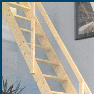
Space saving staircases